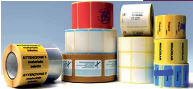
ETICHETTE PER LA SANITÀ / HEALTHCARE LABELLING