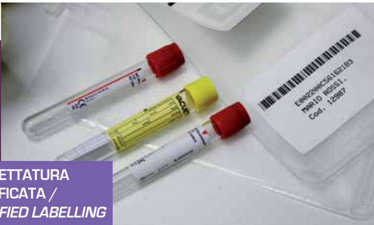
ETICHETTATURA CERTIFICATA / CERTIFIED LABELLING

Ceracarta manufactures a wide range of RFID products for the healthcare system. They are mainly employed for the identification of patients inside hospital premises and/or their tests in Labs. Ceracarta Spa has also designed products to improve management efficiency and logistics of hospital processes, such as RFID labels for inventory items, badges for access and staff control, etc.