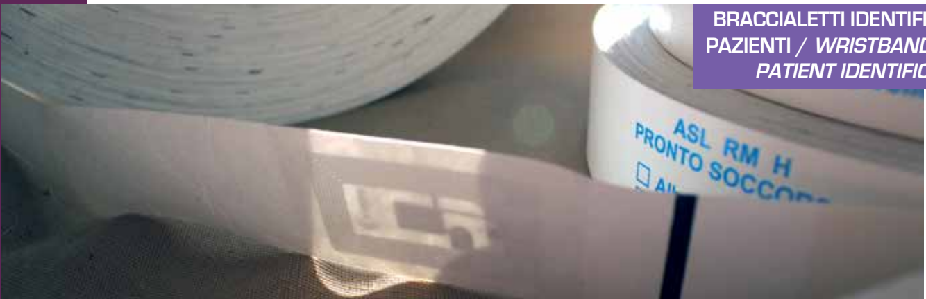
BRACCIALETTI IDENTIFICATIVI PAZIENTI / WRISTBANDS FOR PATIENT IDENTIFICATION

All RFID labels intended for medical use manufactured by Ceracarta can safely be employed in test labs, transfusion centers, research lab, diagnostic units, and sterilization industries.